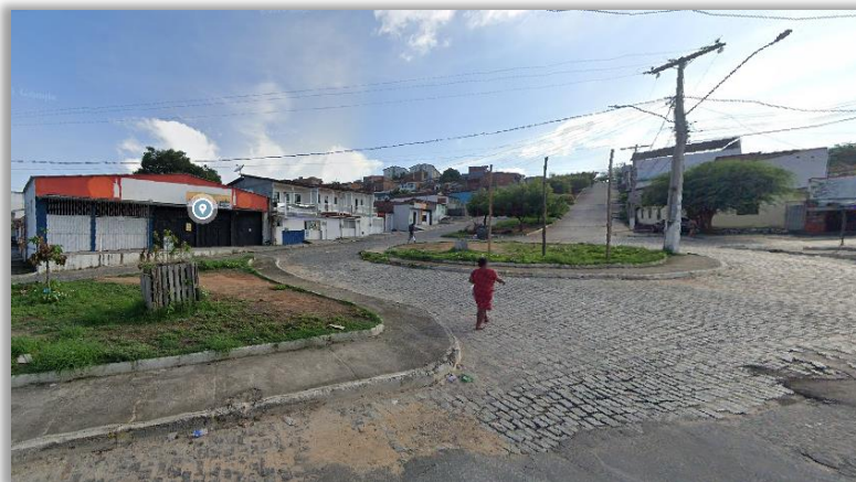
Rotatória e canteiros adjacente da rua alto do cruzeiro.

Entretanto, entendemos que o espaços adjacente à praça também merece atenção por parte do Poder Público, de modo que as intervenções promovidas possam contemplar de forma integrada todo o entorno, proporcionando maior harmonia urbanística, valorização paisagística e melhor aproveitamento dos espaços públicos pela comunidade.