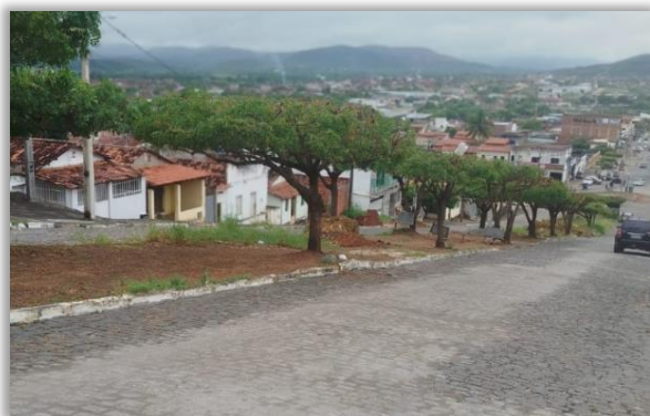
Canteiro central visto de cima

paisagísticas. Destaca-se ainda a presença de diversas árvores já consolidadas no canteiro central, patrimônio ambiental que deve ser preservado e valorizado, uma vez que proporcionam sombra, conforto térmico e contribuem significativamente para a qualidade ambiental do bairro.