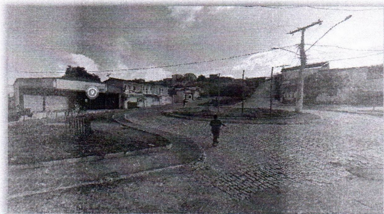
Rotatória e canteiros adjacente da rua alto do cruzeiro.

Entretanto, entendemos que o espaços adjacente à praça também merece atenção por parte do Poder Público, de modo que as intervenções promovidas possam contemplar de forma integrada todo o entorno, proporcionando maior harmonia urbanística, valorização paisagística e melhor aproveitamento dos espaços públicos pela comunidade.