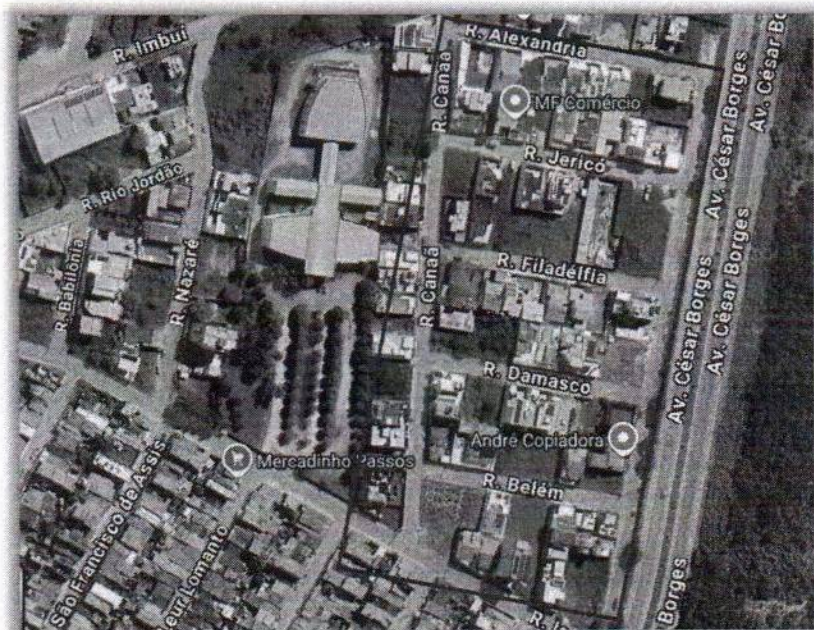
Loteamento Delta Ville

Em diversas ocasiões, o calçamento torna-se inutilizado, deixando trechos das vias praticamente intransitáveis, dificultando o deslocamento de moradores, veículos e até mesmo o acesso de serviços essenciais, como coleta de lixo.