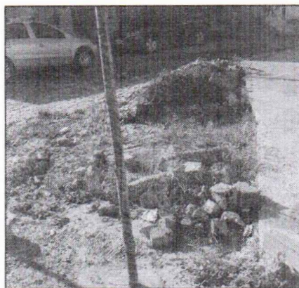
Área por outro ângulo

Em diálogo com os moradores, foi informado que representantes da secretaria, atentos aos anseios da comunidade, planejavam a ampliação do passeio público. A proposta incluiria a instalação de bancos e pergolados, com o objetivo de transformar o espaço em um local agradável para convivência e lazer, além de promover a valorização do ambiente urbano.