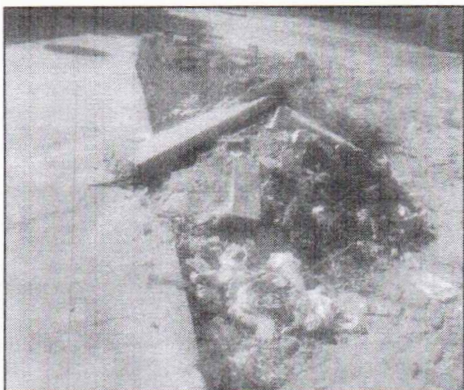
Área referida com entulho