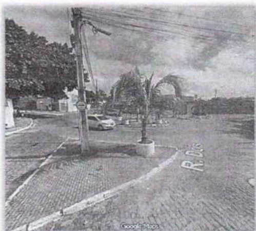
Rotatória da Av. José Moreira Sobrinho.

A Avenida José Moreira Sobrinho é uma das vias mais importantes e movimentadas da cidade, desempenhando papel fundamental na mobilidade urbana e no fluxo diário de veículos, pedestres e ciclistas. O canteiro central e a rotatória existentes ao longo da avenida, no entanto, apresentam desgaste visível, com elementos estruturais deteriorados, áreas verdes insuficientes e sinalização pouco destacada, fatores que comprometem a estética, a segurança e a funcionalidade do espaço.