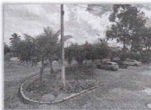
Um dos canteiros da Avenida.