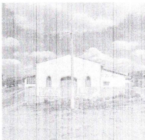
"Igrejinha" na rua Vovó Camila

O referido imóvel, atualmente em estado de desuso e com sua estrutura física comprometida pelo tempo, possui um valor histórico e social inestimável para a comunidade. Sua localização estratégica facilita o acesso de moradores de diferentes bairros, o que permitirá a ampliação das atividades culturais, sociais e educacionais.